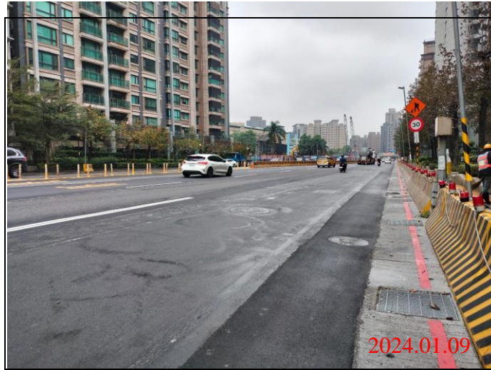
巡查日期地點：113.01.09/ Y23車站 照片說明：路面狀況