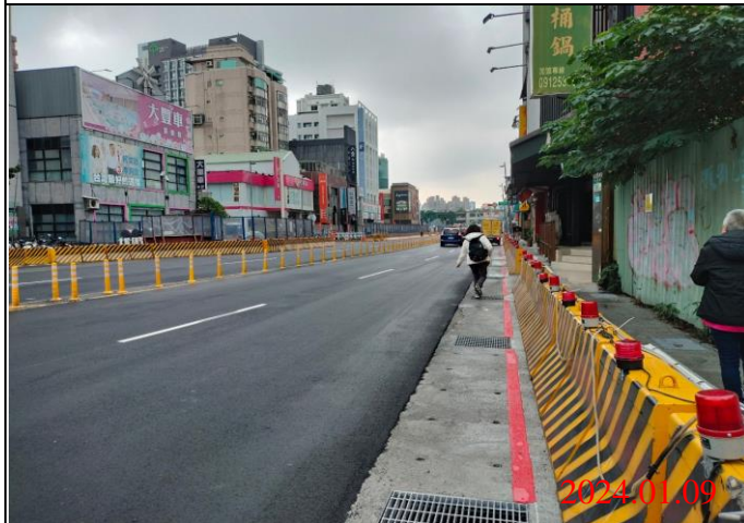
巡查日期地點：113.01.09/ Y21車站 照片說明：路面狀況