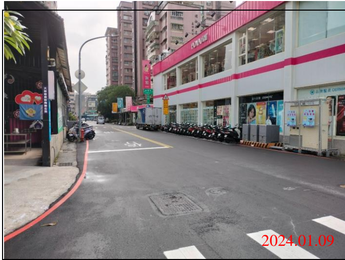
巡查日期地點：113.01.09/ Y21車站 照片說明：路面狀況