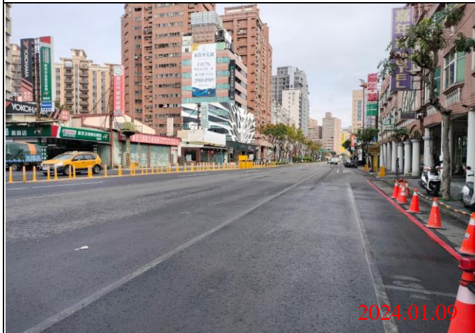
巡查日期地點：113.01.09/ Y21車站 照片說明：路面狀況