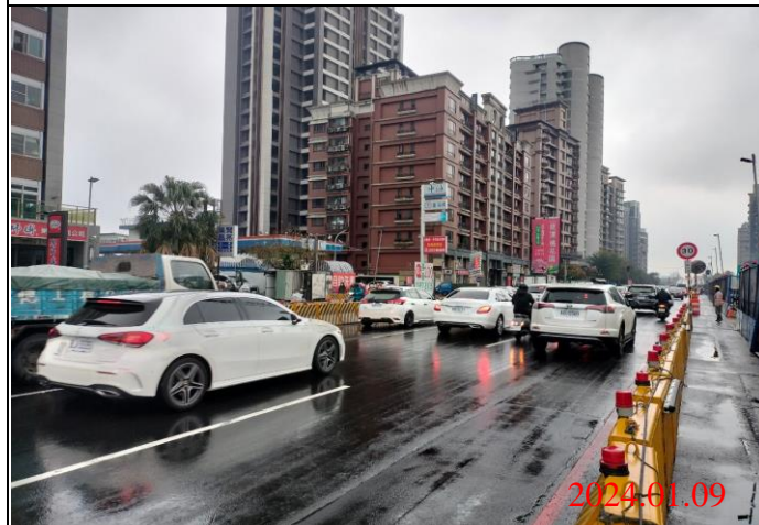
巡查日期地點：113.01.09/ Y23車站 照片說明：路面狀況