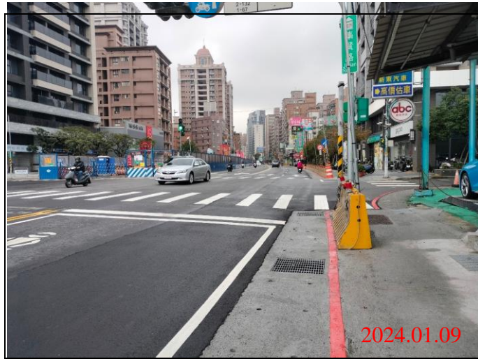
巡查日期地點：113.01.09/ Y22車站 照片說明：路面狀況