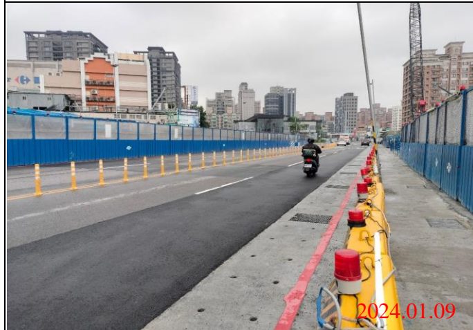
巡查日期地點：113.01.09/ Y22車站 照片說明：路面狀況