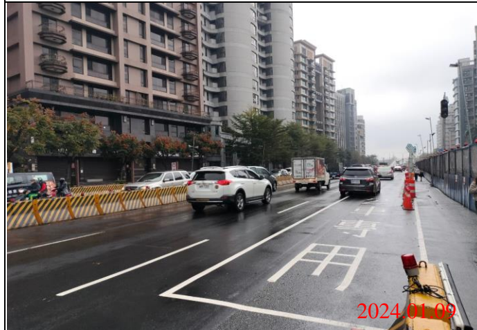
巡查日期地點：113.01.09/ Y23車站 照片說明：路面狀況